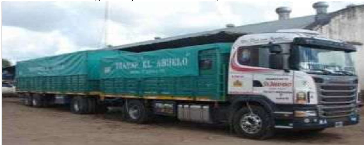
El camión de verduras ingresó al Chaco evadiendo cargas impositivas

La detección la realizó la ATP, en uno de los operativos de control ordinarios en los puestos fronterizos, que se realizan periódicamente para el ingreso, egreso y venta en negro de producción primaria.